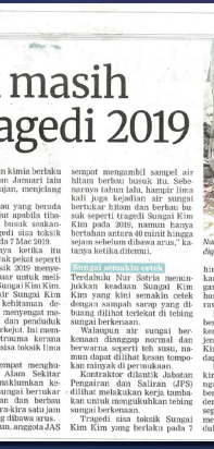
Penduduk di kawasan tersebut masih mengalami trauma akibat pencemaran bau kimia yang berlaku pada tahun 2019.