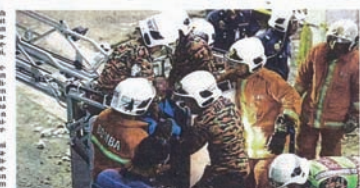
Anggota bomba dan Penyelamat memulau mayat mangsa yang tersepit kren tumbang di Kuala Lumpur, semalam.

Kuala Lumpur Seorang buruh maut selepas tersepit di antara punggul bina dan kren yang tumbang di kawasan pembinaan jambatan di Jalan Damansara, di sini, semalam. Kejadian kira-kira jam 6 petang yang maut membabitkan seorang pekerja lain cedera, dipercayai berlaku apabila kren yang sedang mengangkat punggul bina tiba-tiba tumbang, menyebabkan kren yang berada di situ tersepit. Pengarah Pengarah Operasi Jabatan Bomba dan Penyelamat Kuala Lumpur, Azman Ismail, berkata pihaknya menerima panggilan kecemasan pada jam 4.30 petang setelah 22 anggota terbabit dan seorang dibahar ke lokasi kejadian. Sikap berhati-hati "Berita tida di buai, mangsa dibahar sebelum 10.30. Sa, dia tercampak di antara punggul bina dan kren pada ketinggian kira-kira lima meter." "Mangsa sukar mengambur fumes selepas tercampak keatasnya yang tercampak di Kuala Lumpur, semalam."