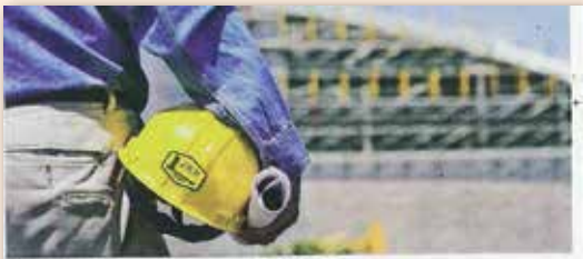
Training will improve the livelihood of individuals.