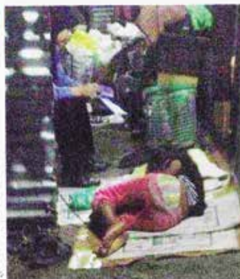
Seorang pesakit mental berusia 20 tahun dibantu oleh kakitangan yang tinggal di Kampung Tangkal Batu, Klang, Selangor.

K EMALANGAN seorang yang dipercayai melibatkan masalah kesihatan mental merupakan isu yang semakin meningkat dan memuncak beberapa tahun ini. Sejak dari tahun 2010, bilangan kes kemalangan yang melibatkan masalah kesihatan mental semakin meningkat. Hal ini menunjukkan bahawa kesihatan mental adalah aspek yang semakin penting dalam kehidupan masyarakat kita yang semakin maju dan moden.