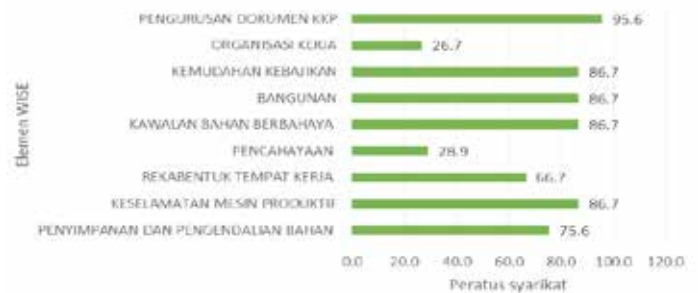
Rajah 8.3 Masalah yang dikenalpasti di dalam pengurusan syarikat IKS

Objektif utama audit KKP dijalankan adalah bagi mengenalpasti masalah-masalah yang dihadapi oleh syarikat terlibat berpandukan senarai semak yang telah dibangunkan oleh NIOSH. Terdapat 9 elemen yang telah dimasukkan ke dalam senarai semak yang digunakan dan elemen-elemen ini adalah berpandukan kepada elemen yang digunakan di dalam modul latihan WISE yang dibangunkan oleh ILO. Berdasarkan rajah di atas, elemen pengurusan dokumen KKP adalah elemen yang paling banyak dikenalpasti sebagai elemen yang perlu dilakukan penambahbaikan oleh syarikat yang terlibat iaitu sebanyak 95.6% daripada keseluruhan peserta. Data ini menunjukkan bahawa kebanyakan IKS masih tidak mempunyai dokumen-dokumen berkaitan KKP seperti yang dikehendaki di bawah AKKP 1994. Ini diikuti oleh 4 bahagian iaitu 1) kemudahan kebajikan, 2) bangunan, 3) kawalan bahan bahaya dan 4) keselamatan mesin produktif sebanyak 86.7%.