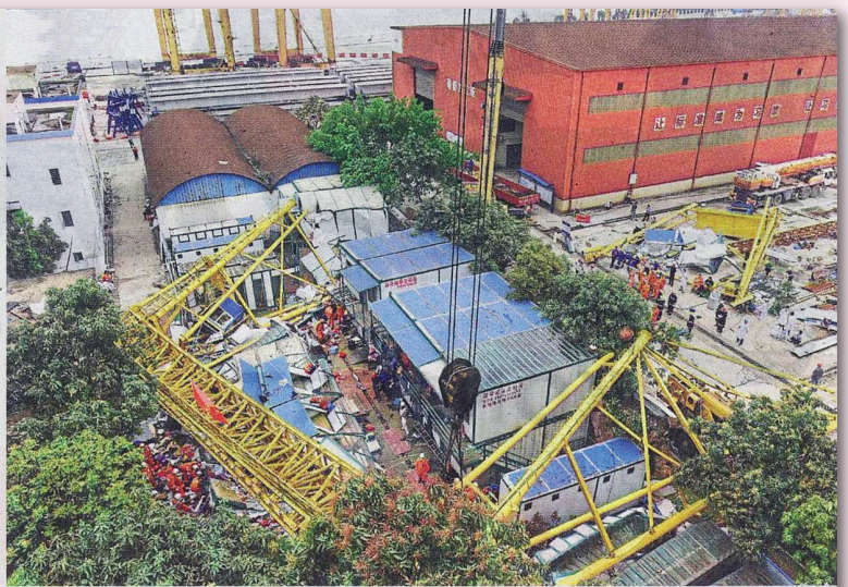
Industrial accident: Rescuers working at the construction site in Mayong Township of Dongguan City. — Xinhua

An investigation had been opened into the accident and 20 million yuan (RM11.7mil) made available by the companies concerned for the recovery and clean up. — AP