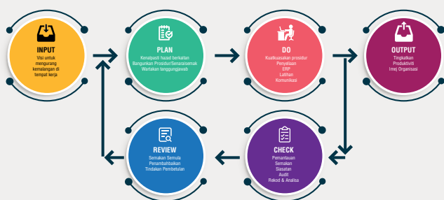
Model pengurusan sistem keselamatan dan kesihatan pekerja

Pengurusan KKP menerusi piawaian OHSAS 18001 dan ISO 45001 adalah berdasarkan konsep Deming iaitu Plan, Do, Check dan Act (PDCA). Berdasarkan kepada konsep tersebut, model pengurusan keselamatan dan kesihatan pekerja boleh dilaksanakan seperti berikut.