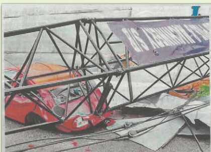
KENDERAAAN yang rosak selepas ditempa besi kren tumbang berhampiran tapak pembinaan @ Taman Century, semalam.